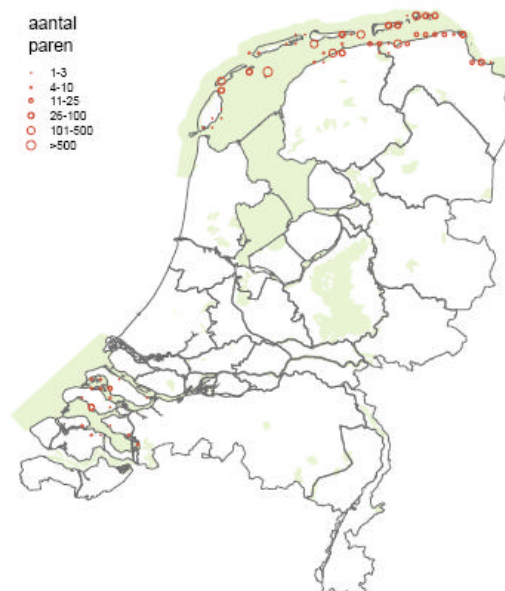
Verspreidingskaartje noordse stern

Huidige verspreiding en voorkomen binnen Nederland: Het verspreidingsgebied van de noordse stern beperkt zich in ons land tot het Waddengebied en het Deltagebied. De soort komt voor op de meeste Waddeneilanden en langs de Fries-Groningse kust. De belangrijkste kolonie bevindt zich op Griend. In het Deltagebied betreft het slechts enkele kleine vestigingen. De natuurlijke verspreiding blijft beperkt tot uitsluitend de kustregio's Waddengebied en (marginaal) de Delta.