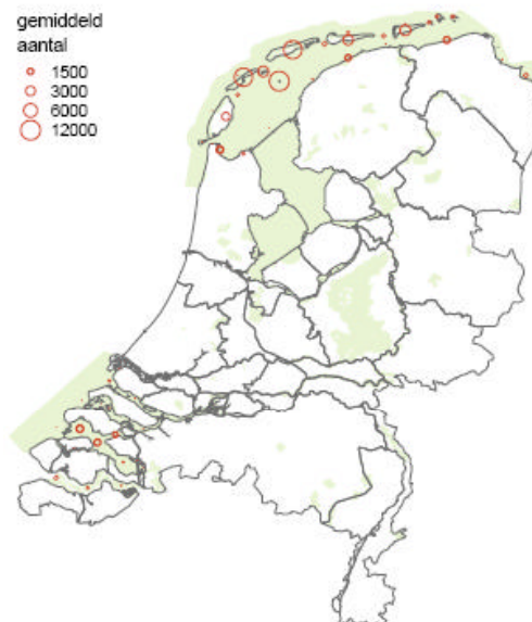
Verspreidingskaart rosse grutto

Huidige verspreiding en voorkomen binnen Nederland: De verspreiding van de rosse grutto concentreert zich in hoge mate in de Waddenzee en in de Oosterschelde, in mindere mate in de Westerschelde en in de Voordelta.