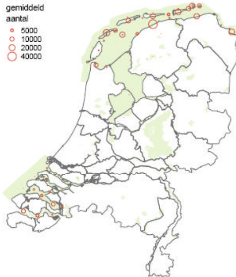
Verspreidingskaart bonte strandloper

Huidig voorkomen en Natura 2000: Vrijwel alle (99%) bonte strandlopers verblijven in ons land in Vogelrichtlijngebieden.