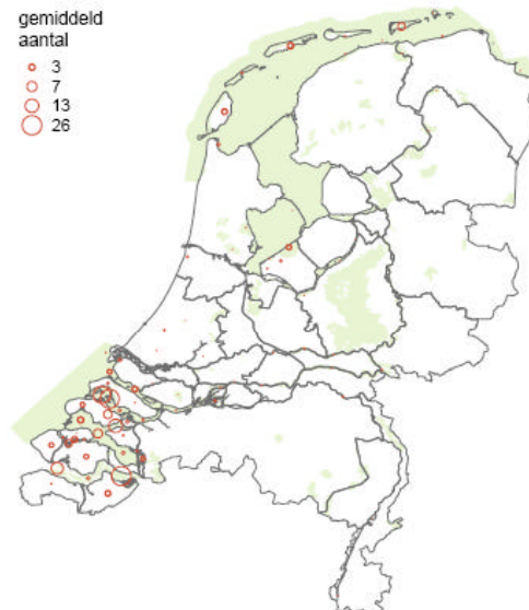
Verspreidingskaart kleine zilverreiger

Huidige verspreiding en voorkomen binnen Nederland: Watervogeltellingen en losse waarnemingen laten zien dat in geheel laag Nederland, incl. de rivieren, geregeld kleine zilverreigers voorkomen. Het zwaartepunt ligt in de Delta (Grevelingen, Oosterschelde, Westerschelde). Ook in de Waddenzee is de soort relatief veel aanwezig.