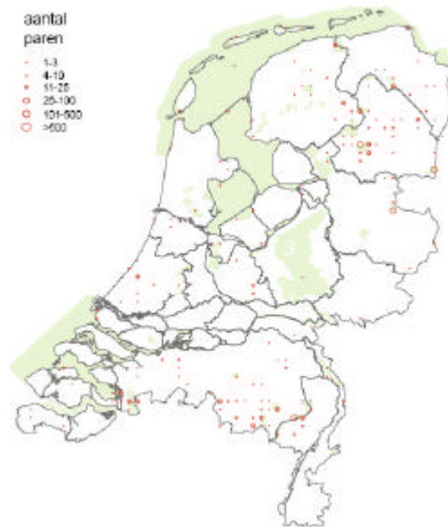
Verspreidingskaart geoorde fuut (broedvogel)

Huidig voorkomen en Natura 2000: In de periode 1999-2003 werden in Nederland gemiddeld 490 paren geteld. Daarvan broedde 68% in onder de Vogelrichtlijn aangewezen gebieden.