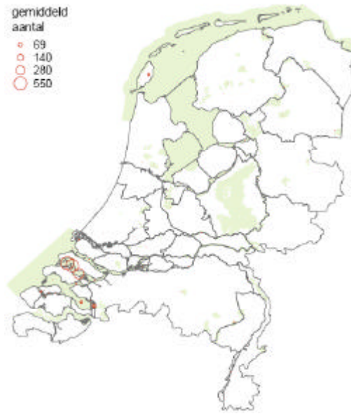
Verspreidingskaart geoorde fuut (niet broedvogel)