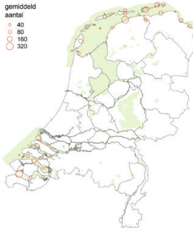
Verspreidingskaart bontbekplevier (niet broedvogel)