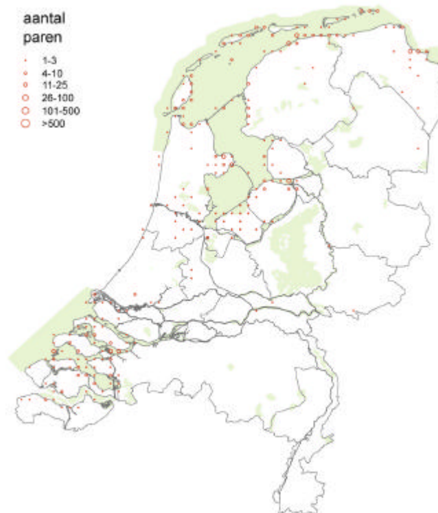
Verspreidingskaart bontbekplevier (broedvogel)

de soort spaarzaam voor in het IJsselmeergebied (Ketelmeer, Vooroever bij Onderdijk). De natuurlijke verspreiding betreft feitelijk alleen de kustregio's. Buiten de kustregio is deze steltloper gebonden aan door de mens geschapen pioniersituaties.