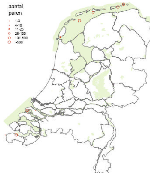
Verspreidingskaart grote stern

Huidige verspreiding en voorkomen binnen Nederland: Het verspreidingsgebied van de grote stern is beperkt tot een klein aantal kolonies in het Wadden- en Deltagebied. Grote kolonies zijn er op Griend (Waddenzee), op de Hooge Platen (Westerschelde) en tot voor kort in de Grevelingen. Nu en dan treden vestigingen daarbuiten op, maar die zijn vaak weinig succesvol.