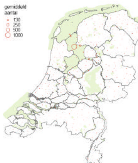
Verspreidingskaart grote zaagbek

Huidige verspreiding en voorkomen binnen Nederland: Overwinterende grote zaagbekken zijn in Nederland sterk geconcentreerd in het IJsselmeergebied. Van enige betekenis zijn ook de plassen in Friesland en Noordwest-Overijssel.