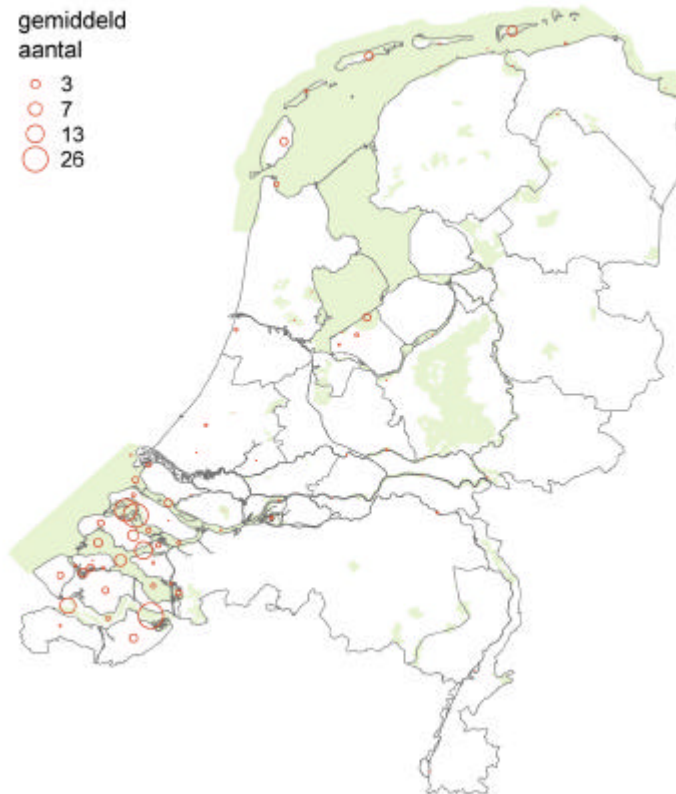
Verspreidingskaart kleine zilverreiger

Watervogeltellingen en losse waarnemingen laten zien dat in geheel laag Nederland, incl. de rivieren, geregeld kleine zilverreigers voorkomen. Het zwaartepunt ligt in de Delta (Grevelingen, Oosterschelde, Westerschelde). Ook in de Waddenzee is de soort relatief veel aanwezig.